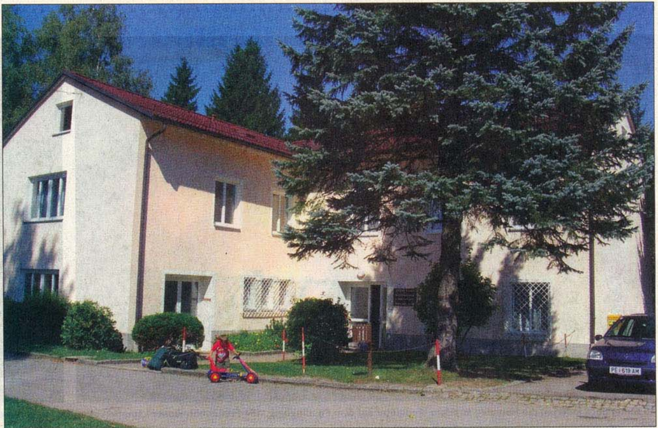
Drama im Flüchtlingsquartier in Bad Kreuzen (Bezirk Perg): Hochschwängere verblutete nach Aorta-Riss im Notarzwagen.